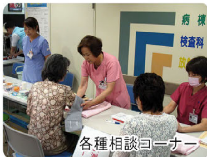
各種相談コーナー