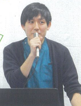
前回講演の岩瀧作業療法士

日常生活の中で身近な“笑い”がもたらす健康効果について講演していただきました。参加者より好評の講演でした！