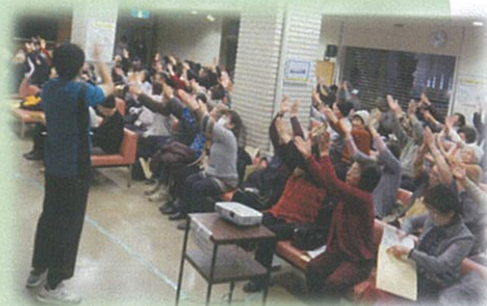
毎回好評の健康体操