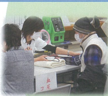
血圧測定コーナーの様子