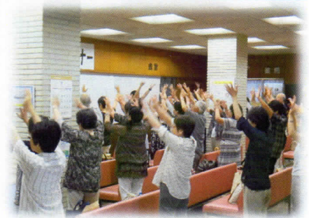
毎回好評の健康体操