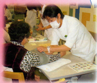
血圧測定コーナーの様子