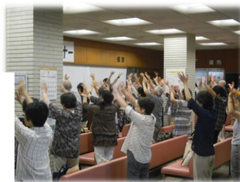
毎回好評の健康体操