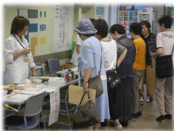
栄養相談等 各種相談コーナー