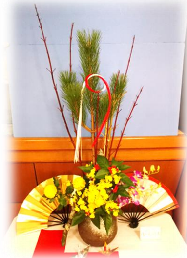
新春を飾る 佐々木 峰良先生作品